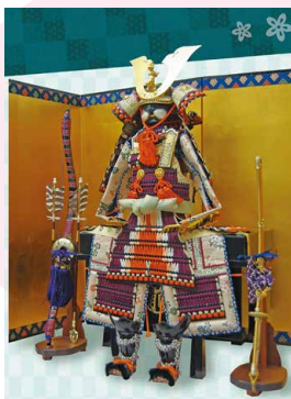
金沢くらしの博物館