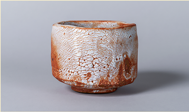
荒川豊蔵《志野茶碗 銘 不動》1953年頃 東京国立近代美術館蔵

日本では茶の湯の発展とともに、さまざまな素材を用いた“茶の湯のうつわ”がつくられてきました。それらは、つねに時代を映す鏡のように、新たな考えや造形を見せています。工芸家の個を映し出す「表現のうつわ」と使い手の文脈で選ばれた「見立てのうつわ」。時代によって移りゆく、茶の湯をめぐる美のかたちを四季の取り合わせの中で探ります。