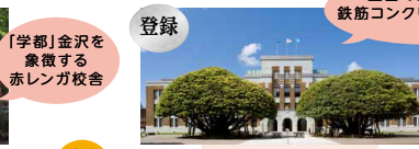
しいのき迎賓館 (旧石川県庁舎本館)