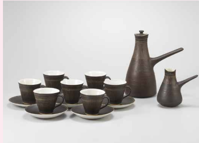
ルーシー・リー《コーヒー・セット》 1960年頃 東京国立近代美術館蔵 Estate of the artist