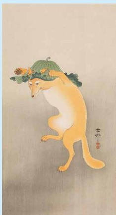
小原古邨「踊る狐」(明治後期、中外産業株式会社原安三郎コレクション)