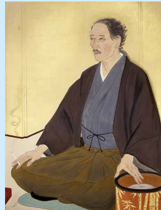
安田鞞彦《大観先生像》 東京国立近代美術館蔵