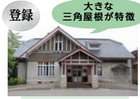
県立美術館広坂別館 (旧陸軍第九師団長官舎)