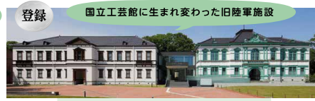
国立工芸館 (旧陸軍第九師団司令部庁舎・金沢偕行社)