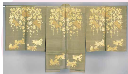
能装束 淡萌葱地枝垂桜胡蝶楓夜文長絹 金沢市指定文化財 金沢能楽美術館蔵