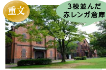
いしかわ赤レンガミュージアム (旧金澤陸軍兵器支廠兵器庫)

①日時：4/29(木・祝) 10:15~13:15 料金：3,500円(ランチ付) ②日時：6/26(土) 13:15~16:00 料金：2,000円(スイーツ付)