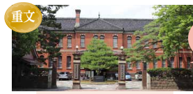
石川四高記念文化交流館 (旧第四高等学校本校館)