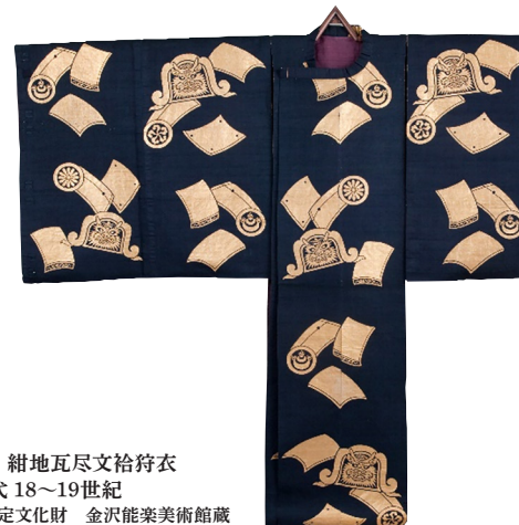
能装束 紺地瓦尽文袴袴衣 江戸時代 18~19世紀 金沢市指定文化財 金沢能楽美術館蔵