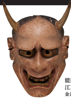
能面 般若「天下一河内」 江戸時代 18世紀 金沢市指定文化財 金沢能楽美術館蔵

能は室町時代(1338~1573)に観阿弥・世阿弥によって大成された仮面劇です。謡(詩)と舞(ダンス)と囃子(音楽)が一体となった日本のミュージカルとも言えます。