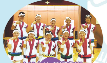
丸谷太鼓 若獅子組 (能美市) 平成29年 日本太鼓ジュニアコンクール 全国大会 出場