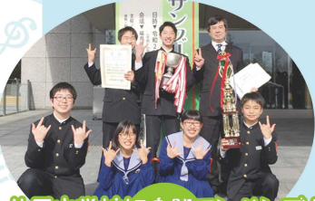
北辰中学校打楽器アンサンブル (白山市立北辰中学校吹奏楽部) 令和元年 北陸アンサンブルコンテスト 金賞 (北陸支部代表→全国大会中止)