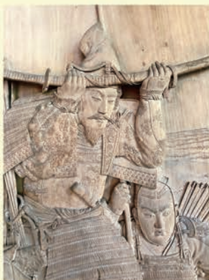
村上九郎作 「新田義貞稲村ヶ崎宝剣激浪に投ず」(部分) 明治26年(1893) 藤島神社蔵

工芸作家の成長には、師である教育者の存在が重要な意味をもちます。本展では、近現代石川県における工芸教育者の代表作や教育資料類を一堂に展示することにより、工芸王国を創り上げた、革新的な教育内容を紹介します。