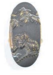
かしら 刀装具 頭 竹虎図