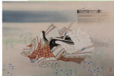
竹取物語絵巻 第五巻より