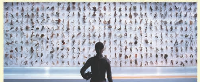
ムン・キョンウォン&ジョン・ジュンホ《世界の終わり》2012年 金沢21世紀美術館蔵 ©MOON Kyungwon and JEON Joonho

2つの新作映像インスタレーションをはじめとして、アポカリプス前後の異なる時間軸とその接続を描いた代表作《世界の終わり》や金石地区での潜在制作による作品など、彼女たちの活動を多面的に紹介します。