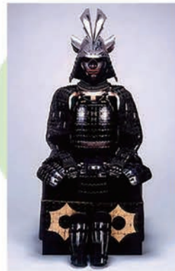
黒漆塗黒糸威二枚胴具足 前田利政所用