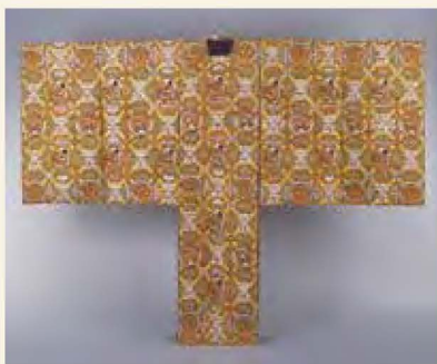
おきなりぎぬ 翁狩衣 ことぶきし なな たけこうしほうおうまるまりくもよう 寿字に斜め竹格子鳳凰丸桐菊模様 彦根城博物館所蔵

金沢の伝統芸能のひとつである「加賀宝生」。江戸時代の頃から宝生流の能が盛んな加賀藩を象徴する前田家伝来の能装束61点と能面15点を紹介します。幕末の藩主と能の関わりを考えながら、地方独自の発展を遂げた加賀藩の能楽史をふりかえります。