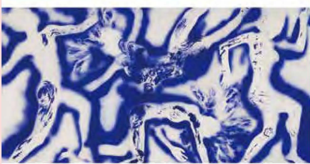
イヴ・クライン《人体測定(ANT66)》1960年 水性メディウム、紙、カンヴァス 157 × 311cm いわき市立美術館蔵

1950年代から60年代に活躍したフランスのアーティスト、イヴ・クラインを中心に同時代から現代の作家の取り組みまでを紹介します。戦後の「タブラ・ラサ(空虚)」から始まった人間性の新たな探求は、不確かな現代を生きる私たちに多くの示唆を与えてくれるでしょう。