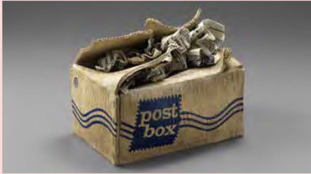
三島喜美代 (Work-86-B) 1986-87年 東京国立近代美術館蔵

東京国立近代美術館が所蔵する国内外の優れた工芸・デザイン作品を中心に、あえて工芸と括らずに新しい視点でご紹介する展覧会です。器からオブジェまで形状はさまざまですが、鑑賞者はジャンルを気にすることなく、工芸素材とそれを活かす卓越した技術を用いた幅広い表現に触れることができます。