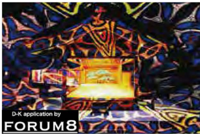
デジタル掛軸イメージ

10.1 [土] 13:30 デジタル掛軸 開始 14:30 開演(~16:00頃)