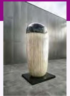
金子潤《Untitled (13-09-04)》2013年