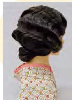
髪形再現資料「耳隠し」