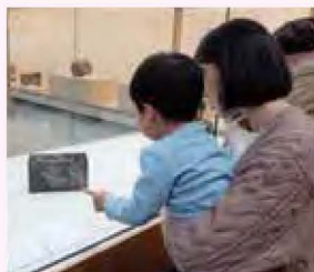
昨年度の鑑賞会より