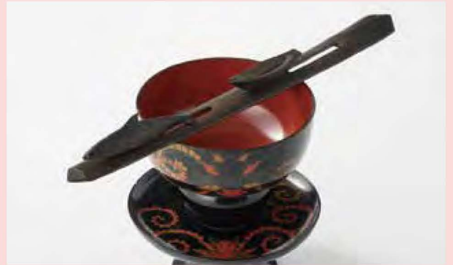
捧酒箸(逃げるシャチと追いかける舟) 北海道博物館蔵

「アトウイ」はアイヌ語で「海」。アイヌにとって海は生業の場であり、外の世界と繋がる交易の道でもありました。北前船による蝦夷地と本州の産物往来にも、アイヌが深く関わります。