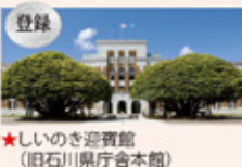
★登録 しいのき迎賓館 (旧石川県庁舎本館)