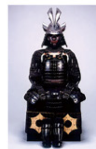
黒漆塗黒糸威二枚胴具足 前田利政所用