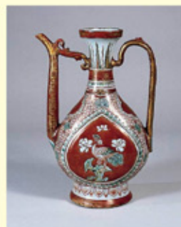
景德鎮窯 《古赤絵金襴手仙鶴瓶》 16世紀、石川県立美術館蔵