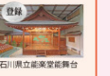
登録 石川県立能楽堂能舞台