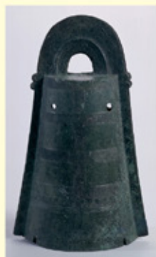
国宝 島根県加茂岩倉遺跡 出土銅鐸 国(文化庁保管)