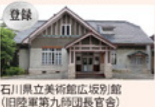
登録 石川県立美術館広坂別館 (旧陸軍第九師団長官舎)