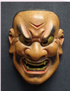
能面 壁 現代 後藤祐自 作