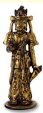
金銅菩薩立像 東京大学総合研究博物館

石川県は古代から大陸の文化が流入する海の玄関口になってきました。この展覧会では、日本沿岸の各地や朝鮮半島・中国大陸との交流を物語る資料を展示し、加賀・能登に繁栄をもたらした日本海交易の源流をたどります。