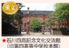
★重文 石川四高記念文化交流館 (旧第四高等学校校舎)