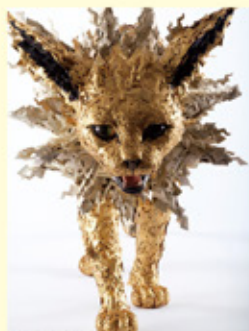
吉田泰一郎 《サンダース》 2022年 個人蔵