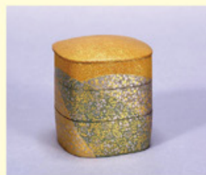
西出大三 《木彫金彩香の匣「みくまの」》 1967年、石川県立美術館蔵

近代に入って大きく発展を遂げた金沢の製箔について紹介するとともに、工芸を唯一無二の作品に仕上げてくれる金彩の魔力を感じていただく展覧会です。燦々とした光を受けて輝くばかりでなく、闇のなか、あるかなきかの明かりを映す金のゆらめき、陰翳のなかの金彩の魅力を堪能ください。