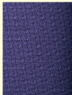
小宮康義 《江戸小紋 着尺「ゲンガー・ゴースト」》 2022年 個人蔵

©2023 Pokémon. ©1995-2023 Nintendo/Creatures Inc./GAME FREAK inc.