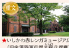
★重文 いしかわ赤レンガミュージアム (旧金澤陸軍兵器支隊兵器庫)