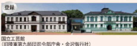
登録 国立工芸館 (旧陸軍第九師司令部庁舎・金沢信託社)

お問い合わせ: ☎076-225-1371 (県文化振興課 ※平日9:00~17:00)