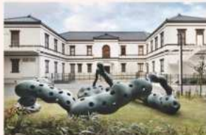
橋本真之《果樹園—果実の中の木もれ陽、木もれ陽の中の果実》1978-88年

国立工芸館の裏庭で強烈な存在感を放つ《果樹園—果実の中の木もれ陽、木もれ陽の中の果実》。光と影をキーワードに、作者の橋本真之氏にお話を伺います。 対象:どなたでも 定員:45名 申込:国立工芸館ウェブサイト (www.momat.go.jp/cg)または同館SNSにてお知らせ 会場: 国立工芸館