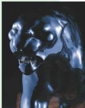
小川雄平《陶製黒豹置物》(部分)1933年 国立工芸館蔵