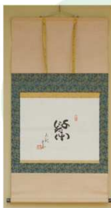
宝生九郎重英 筆「千秋楽」 昭和時代・20世紀