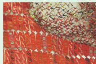
エル・アナツイ《パースペクティブス》(部分)2015 © EL ANATSUI 金沢21世紀美術館蔵